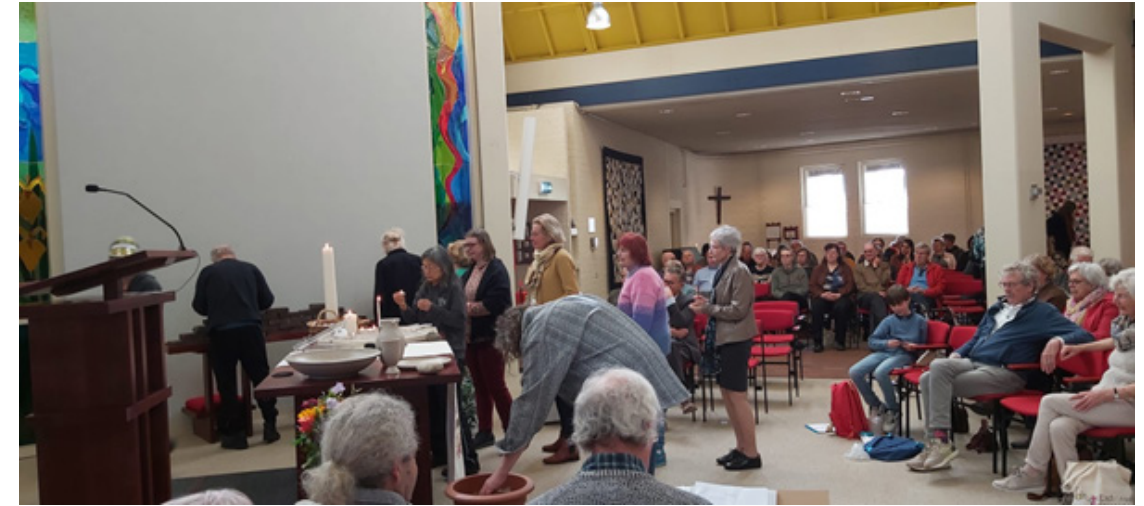
Zingen in de kerk in Kesteren en na afloop gezamenlijk bowlen met de Straatklinders