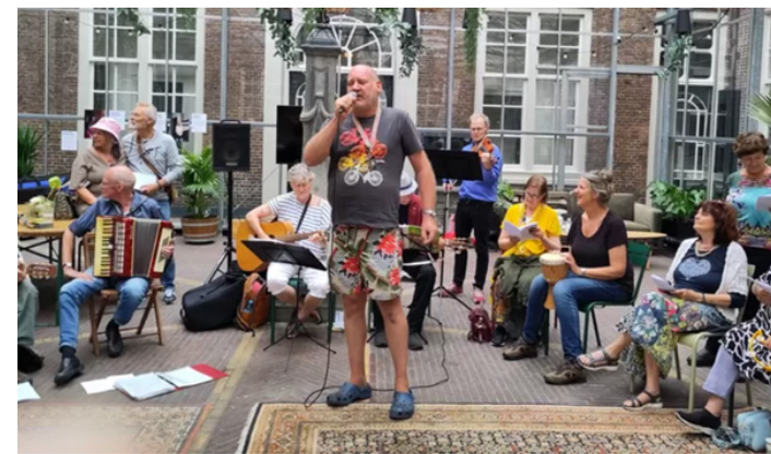
Dak- en thuislozenkoor De Straatklinders tijdens een optreden elders in het land.