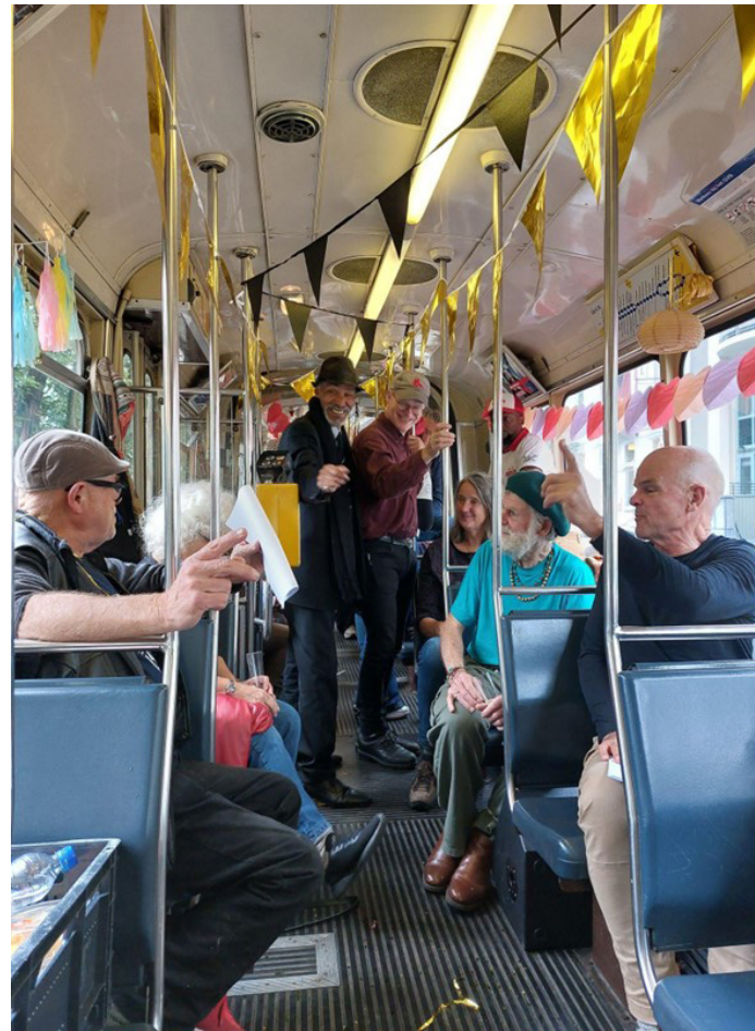
Optreden van de Straatklinders tijdens Amsterdam Dance Event in de rijdende 'Soultram'.

In de huid kruipen van Bijbelse figuren en de kruisweg lopen bij het bedevaartsoord in Heiloo op Goede Vrijdag.